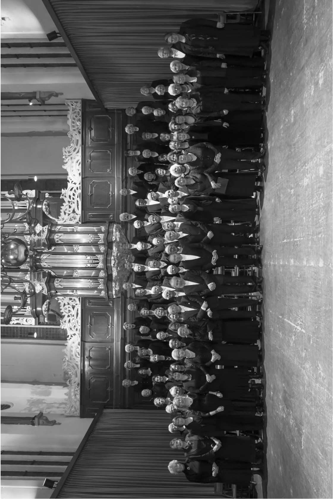
Oratoriumvereniging Soli Deo Gloria opgericht in 1919